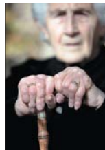
En la fiscalía de Manhattan se procesan unas 700 denuncias de maltrato de ancianos cada año, la mayoría por explotación financiera.

La actividad delictiva puede incluir la explotación económica por parte de cualquier persona, incluyendo parientes, ayudante doméstico, pareja o cualquier otra persona que presta servicios profesionales al anciano, como apoderados legales y maltrato doméstico o abandono por parte de familiares.